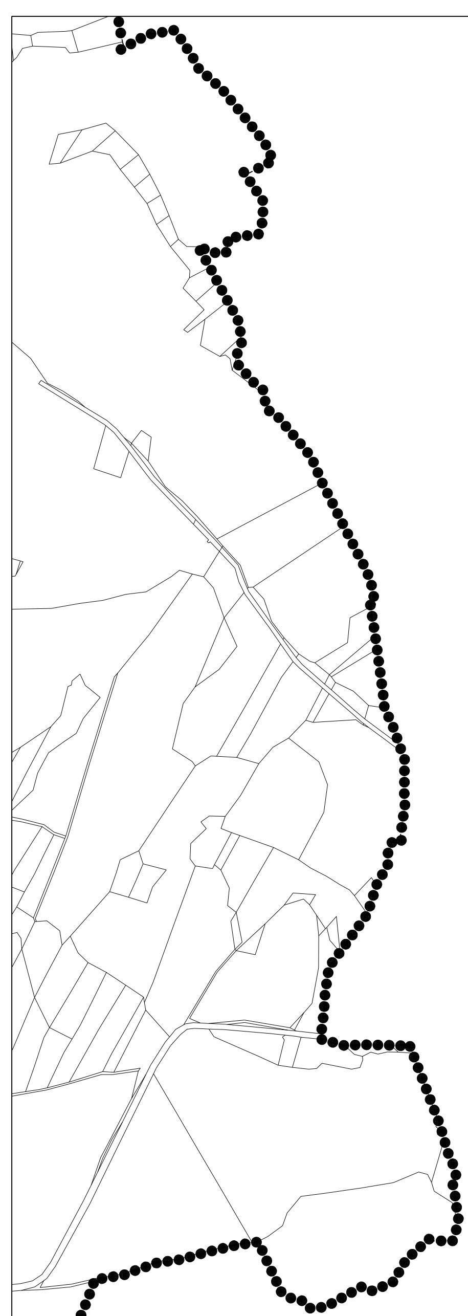
SCHEMA UMÍSTĚNÍ VÝŘEZU VE VZTAHU K ŘEŠENÉMU ÚZEMÍ