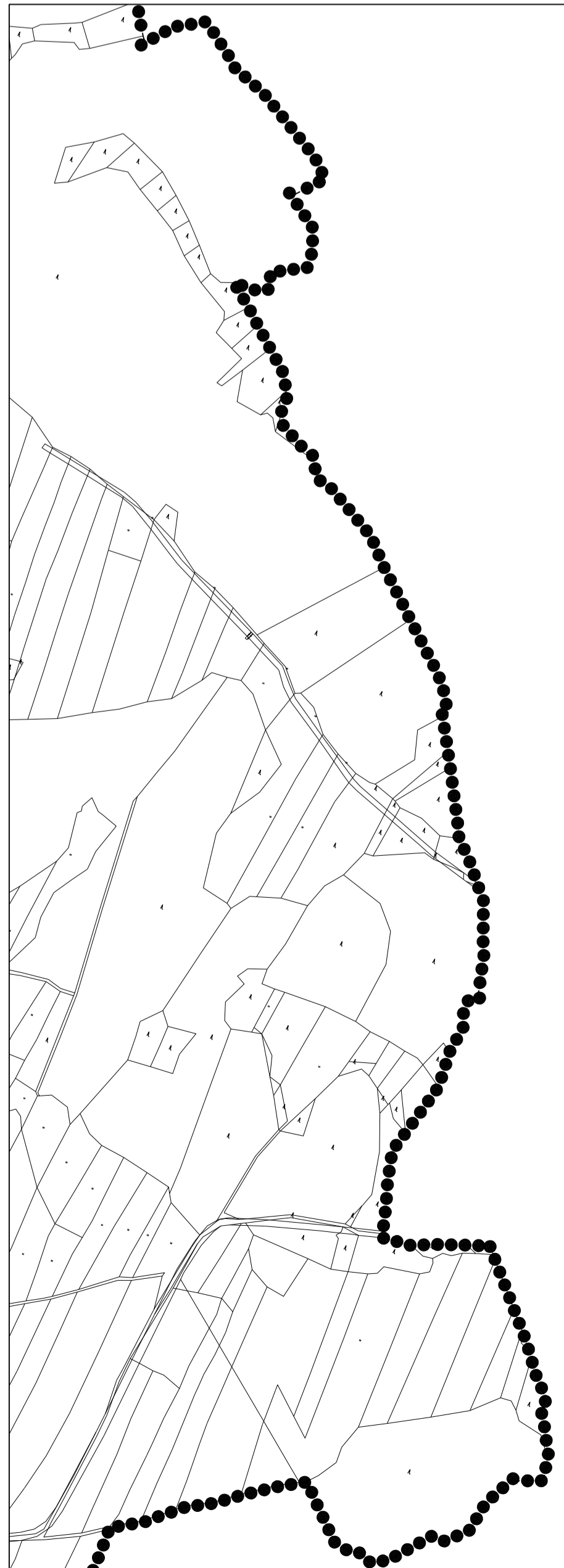
SCHEMA UMÍSTĚNÍ VÝŘEZU VE VZTAHU K ŘEŠENÉMU ÚZEMÍ